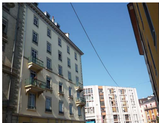
Vue rue Dassier