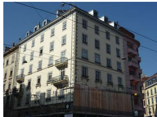
Vue angle rue Dassier, rue Servette